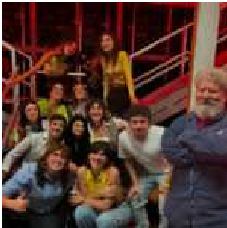
C.I.O.E (*), III edizione con direzione artistica di Lello Arena