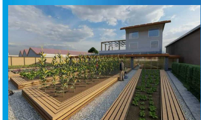
Castellammare, un centro giovanile nell'ex discoteca del clan: ecco come sarà Via alla riconversione del Plan B in via Piombiera