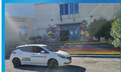
Castellammare di Stabia: Capitaneria di Porto, Comune e scuole insieme per difendere il mare

Promuovere tra i giovani studenti di Castellammare di Stabia una maggiore consapevolezza sulla tutela del mare e delle risorse naturali attraverso un'opera di educazione e sensibilizzazione ambientale. È questo l'obiettivo di una serie di incontri, che coinvolgeranno tutti gli istituti scolastici e che nasce dalla collaborazione tra la Capitaneria di Porto e il Comune di Castellammare di Stabia.