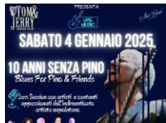
"10 anni senza Pino Daniele":