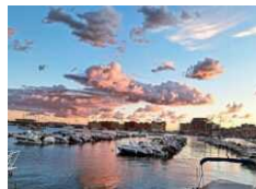
Anzio rientra nel nuovo piano