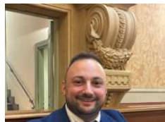
Zuccaro: "Quartiere Europa di Anzio escluso dai programmi di Natale"