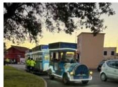
Black out elettrico ad Anzio Colonia, stop a trenino e animazione