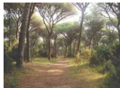
Rischio patogeni a Lido dei