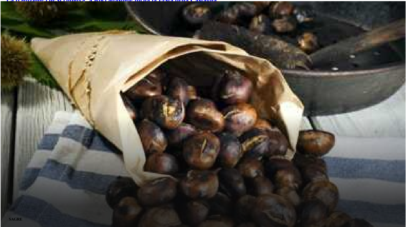
La tradizione notaionista: a San Rufino torna la Festa della Castagna