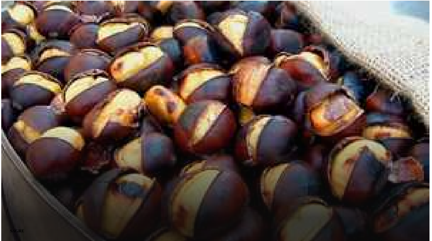
Tradizione, gusto e divertimento: a Stio è tempo di "Festa della Castagna"