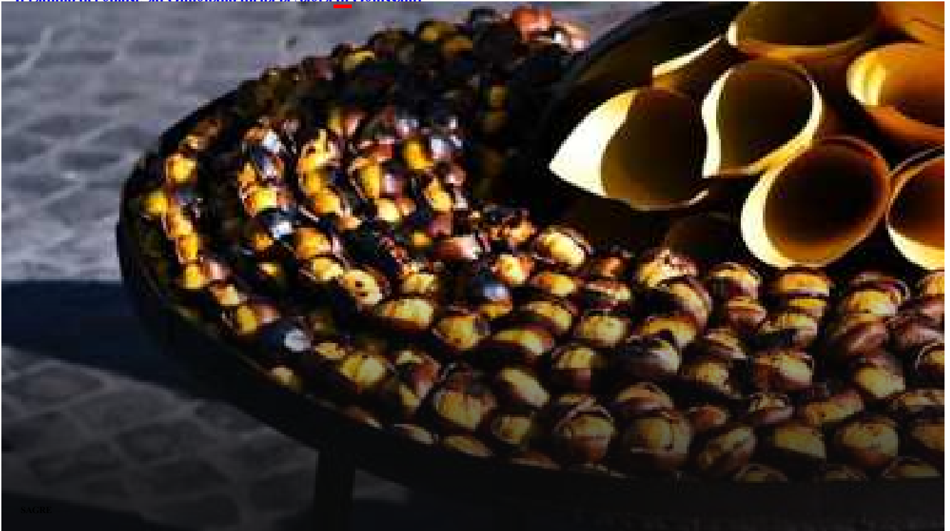
La tradizione che si rinnova: a Roccasnide torna la Festa della Castagna