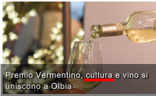
Premio Vermentino, cultura e vino si uniscono a Olbia