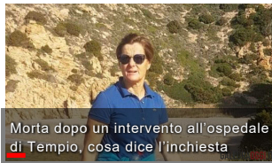
Morta dopo un intervento all'ospedale di Tempio, cosa dice l'inchiesta