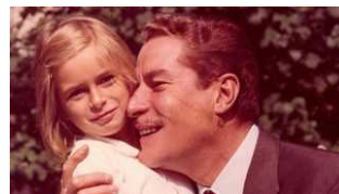
LIBRI ‘Memorie a brandelli’, il