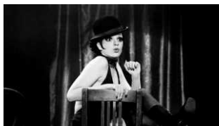
LIBRI Liza Minnelli, in arrivo