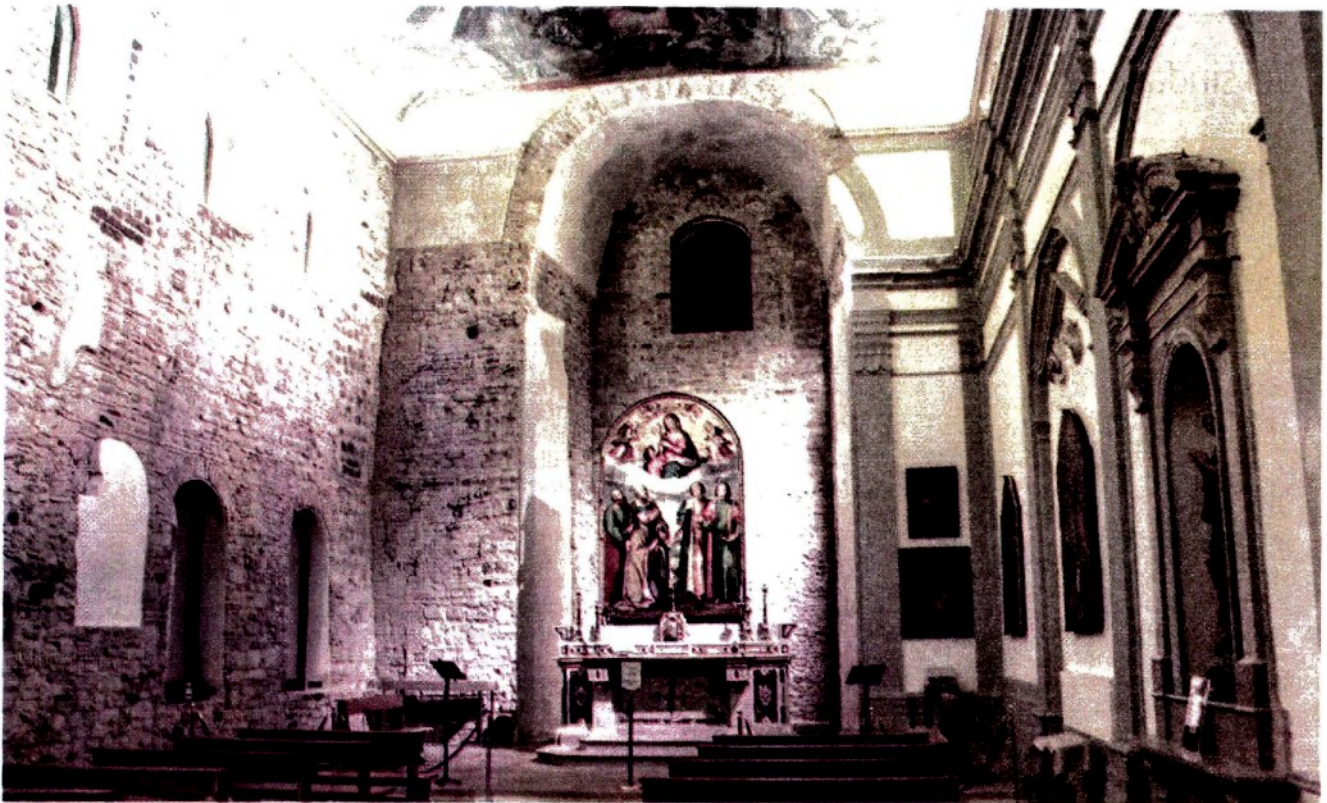
La chiesa di San Pietro a Corte a Salerno di epoca longobarda